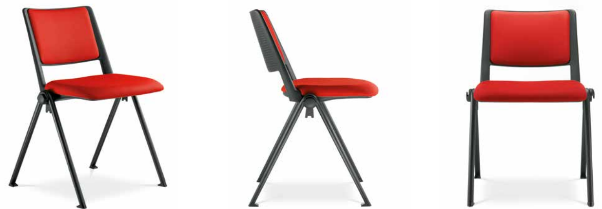
GO! 112 ■