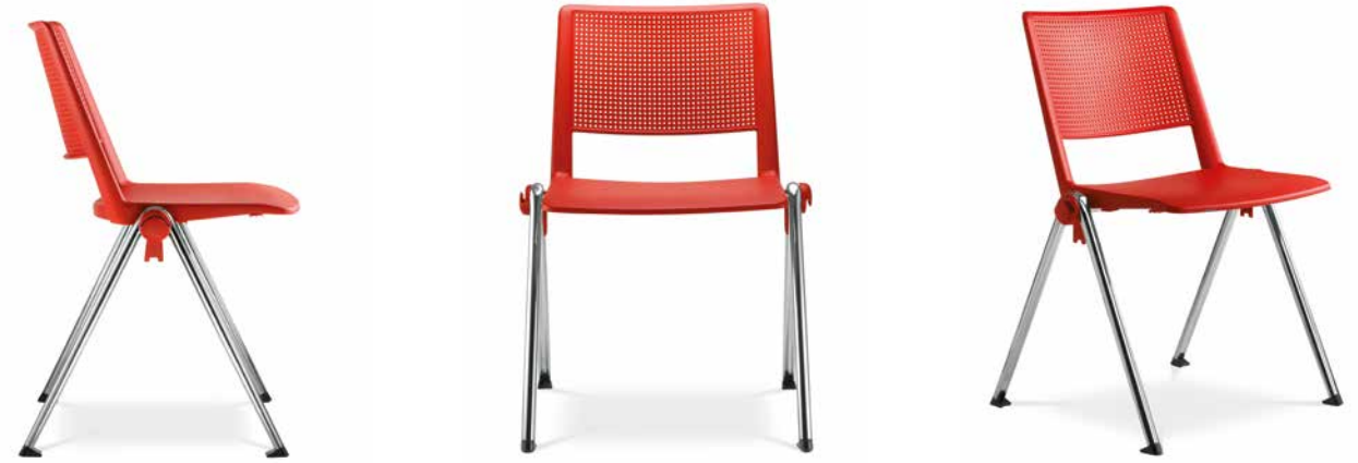
GO! 114 ■