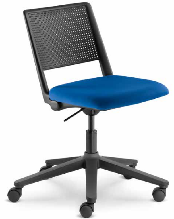
GO! 115 ■ F45