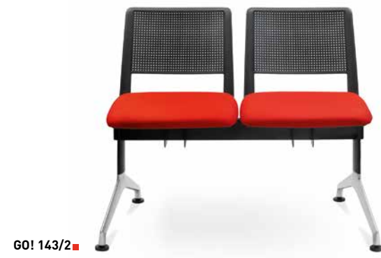
GO! 143/2 ■