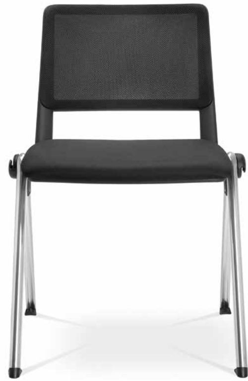
GO! 117 ■