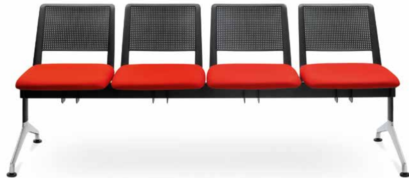
GO! 143/4 ■