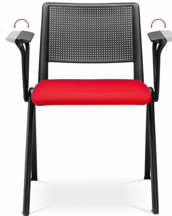
GO! 115 ■ + BR-112