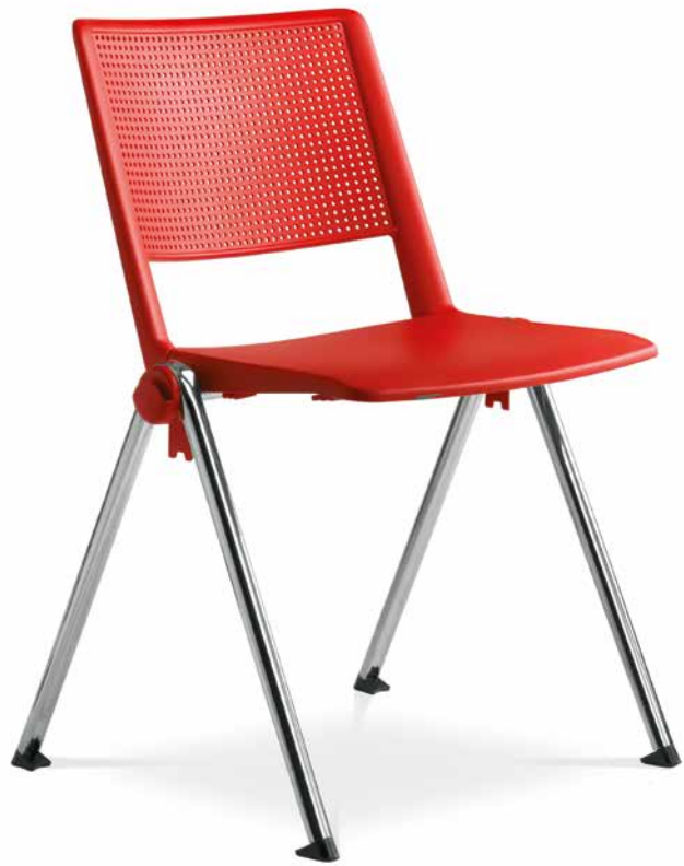
GO! 114 ■