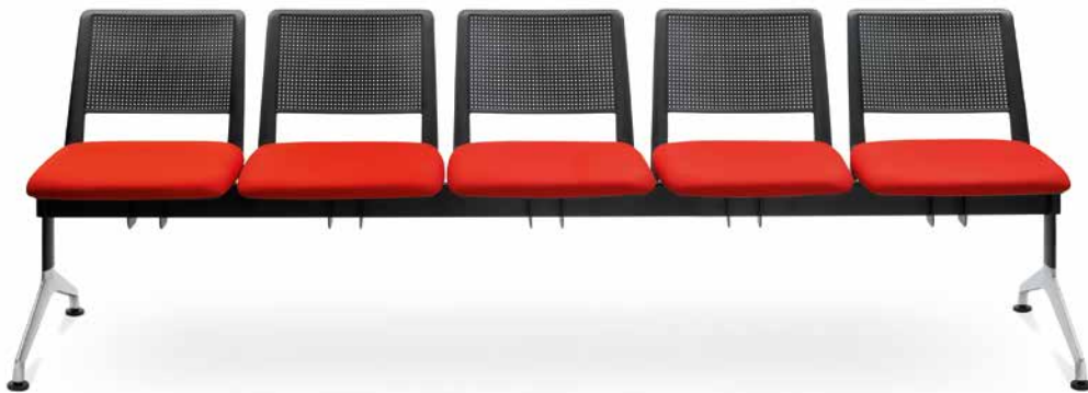
GO! 143/5 ■