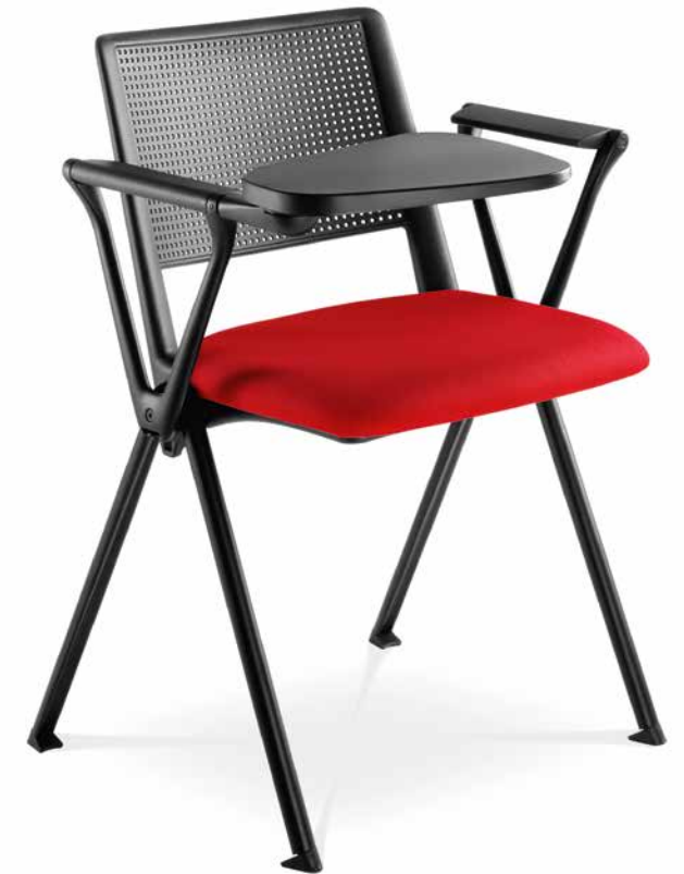
GO! 115 ■ + BR-112 + TP