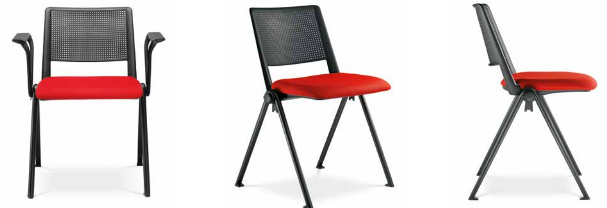
GO! 115 ■