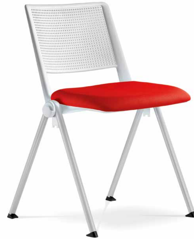
GO! 116 ■