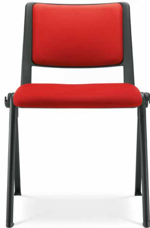
GO! 112 ■