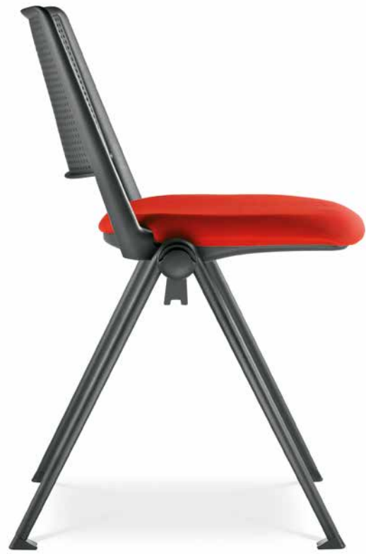
GO! 115 ■