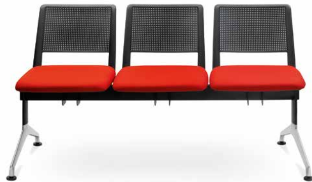
GO! 143/3 ■